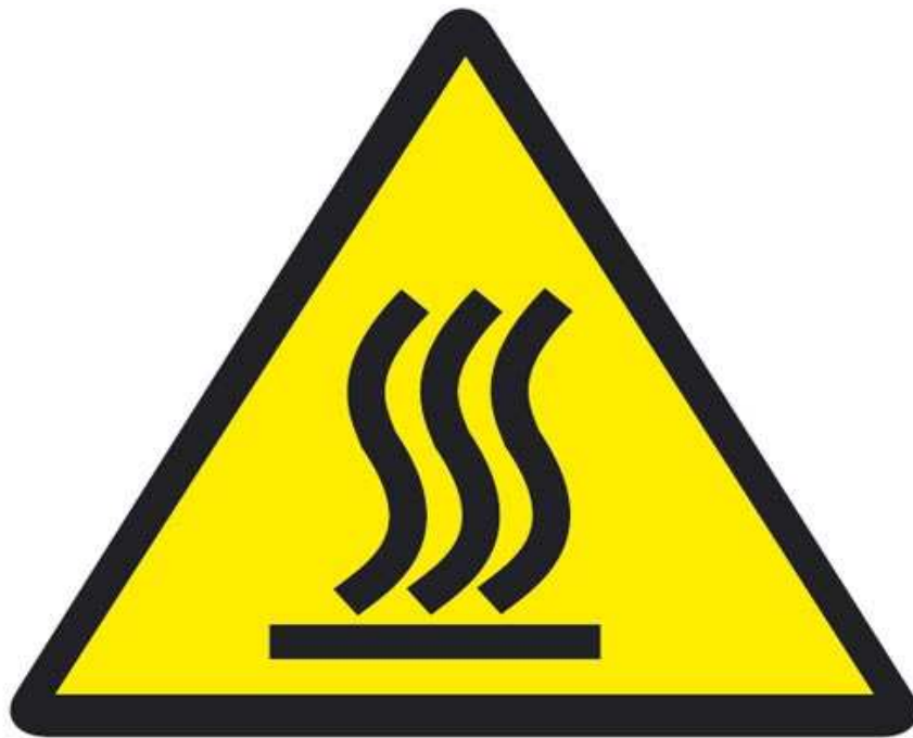
Warnung vor heißer Oberfläche